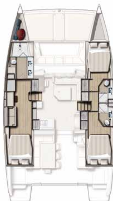
Version 3 cabins / 3 SDB 3 cabin version / 3 bath Versión 3 camarates / 3 cuartos de baños 3 Kabinen, 3 Bäder